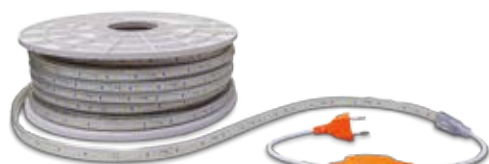
Rectificador 6A 230V no incluido