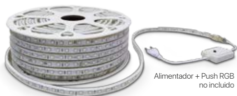
Alimentador + Push RGB no incluido