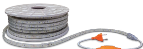
Rectificador 6A 230V no incluido