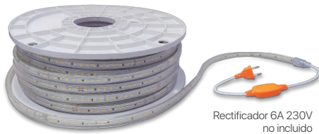
Rectificador 6A 230V no incluido