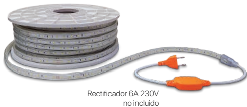
Rectificador 6A 230V no incluido