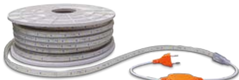
Rectificador 6A 230V no incluido