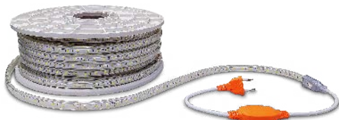
Rectificador 6A 230V no incluido