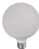
Globo G120 LED 12W E27