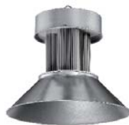
Campana LED 150W