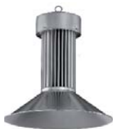
Campana LED 100W