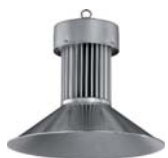
Campana LED 80W