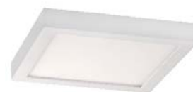
PLAFÓN LED SUPEFICIE CUADRADO BLANCO Y GRIS 22W