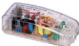
Transformador electrónico 12V 35-105W